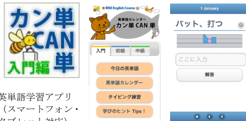
英単語学習アプリ (スマートフォン・ タブレット対応)