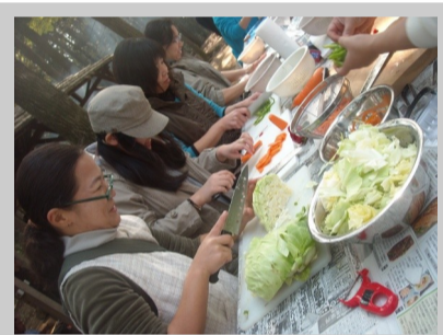
ライズ学園：親子バーベキュー大会

リヴォルヴが目指すところの1つに、「教材の地産地消」があります。茨城の子ども達が使う教材を茨城県内で自製する。そうして得られた収益を、子育て・子育て環境の充実、そして地域の活性化に充てる。