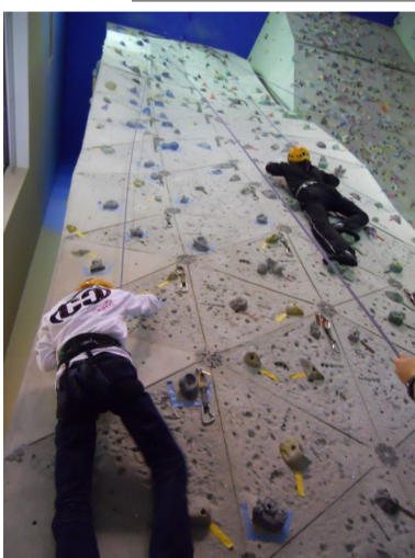
ライス学園：カルチャー教室 ロック・クライミング 協力：NPO法人Monkey Magic

多くの仲間が巣立ち、少しさみしくなった4月。それでも少しずつ仲間が増えて、教室は笑顔でいっぱいになりました。2009年度は受験生が多かったこともあって、フリータイムや放課後まで問題集に取り組むなど、例年にも増して真剣に学習に取り組む姿も目立ちました。