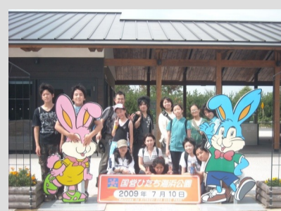
ライス学園：遠足(ひたち海浜公園)