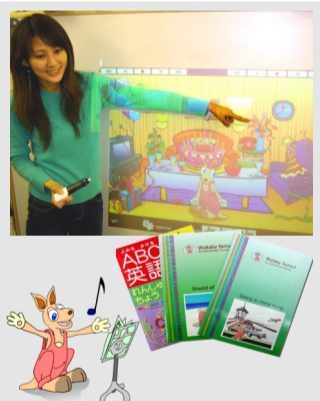
小学生向け英語プログラム Wallaby English 小学校 / 塾向け