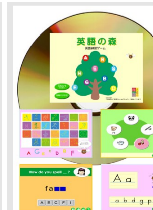
れんしゅうちょう準拠 英語の森 ver. 1.0 試供価格 1,200円(税込)