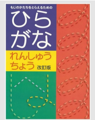
ひらがな れんしゅうちょう 600円(税込)

リヴォルヴの教材は、ライズ学園等で著しい成果を上げた HOW TO を盛り込んだまったく新しい教材です。「ひらがなれんしゅうちょう」をはじめ、全国の小中学校、塾等で採用されています。