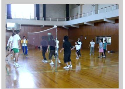
ライズ学園：スポーツの時間 SunGAIAの選手とバレーボール 協力：アクティブつくば

たとえば地域文化・スポーツクラブの活動を推進する。そもそもなぜ、中学生や高校生と別れて活動しなければならないのでしょうか。バレーボールに本格的に取り組みたい子も、ちょっと楽しみたい子も、それぞれにふさわしいチームを選べるようにする。ときには中学生でチームを組み、またときには異年代チームを組み大会に参加する。地域でこれを行えば、学校での活動には参加できない障害をもった子のためのチームだって結成できるかもしれません。将棋を楽しみたい子は、それこそ地域の先輩から指導を受けたほうがいいのではないのでしょうか。