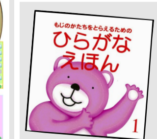
ひらがな絵本 798円(税込)