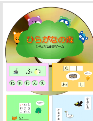
れんしゅうちょう準拠 ひらがなの森 ver. 1.0 試供価格 1,200円(税込)