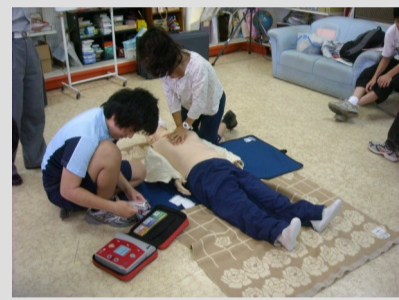
ライス学園：カルチャー教室 「救命救急実習」 協力：つくば市南消防署